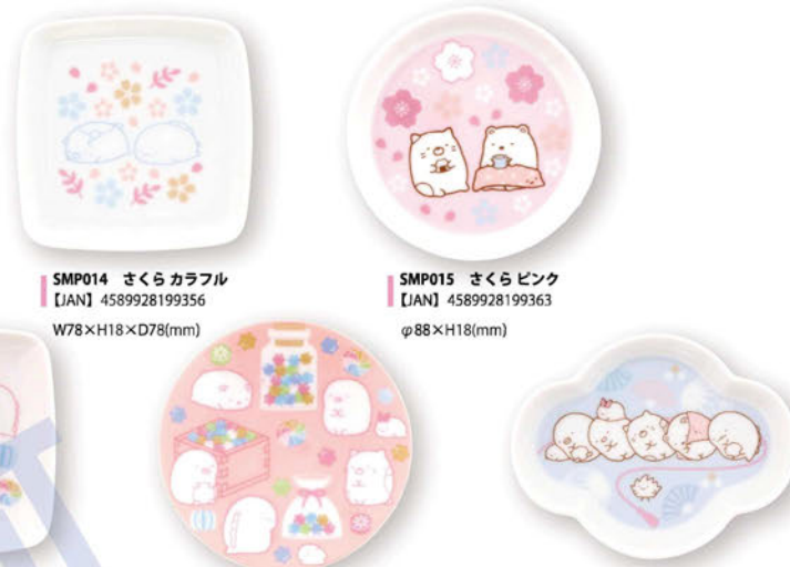
SMP014 さくらカラフル [JAN] 4589928199356 W78×H18×D78(mm)