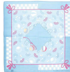
SMP012-03 まりと扇子 [JAN] 4589928198700