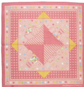
SMP012-02 こんべいとう [JAN] 4589928198694