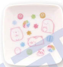
SMP016 こんべいとうカラフル [JAN] 4589928199370 W79×H16×D79(mm)