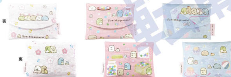
SMP003-01 さくら [JAN] 4589928197253