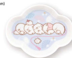
SMP018 まりと扇子ブルー [JAN] 4589928199394 W75×H17×D96(mm)