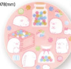
SMP017 こんべいとうレッド [JAN] 4589928199387 φ90×H15(mm)