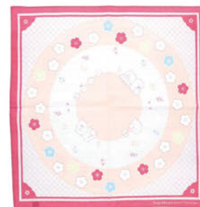
SMP012-01 さくら [JAN] 4589928198678