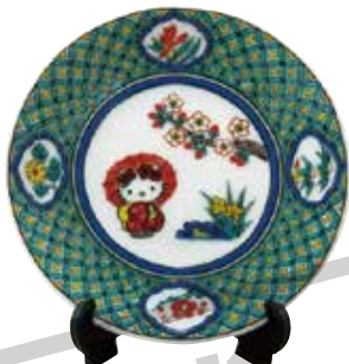
KT462 七宝小紋 [JAN] 4991567800225