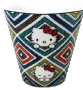
KT489 菱文 [JAN] 4991567800256