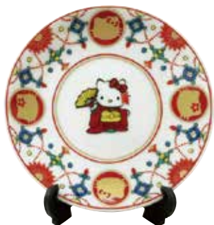
ようらくもん KT461 瓔珞文 [JAN] 4991567800218