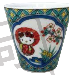
KT491 七宝小紋 [JAN] 4991567800270