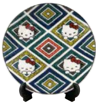
KT460 菱文 [JAN] 4991567800201