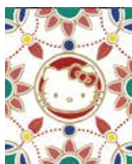
瓔珞文 ようらくもん