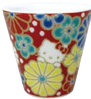
KT488 梅菊 [JAN] 4991567800249