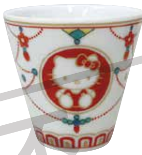
ようらくもん KT490 瓔珞文 [JAN] 4991567800263