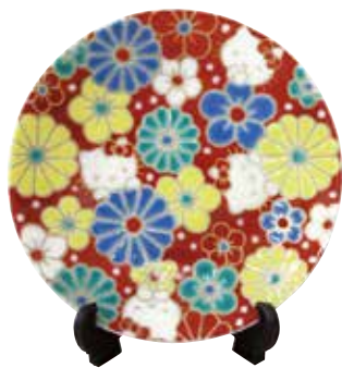
KT459 梅菊 [JAN] 4991567800195