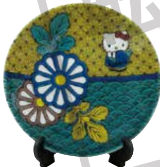
KT463 青手菊文 [JAN] 4991567800232