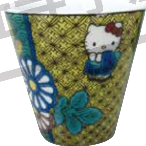
KT492 青手菊文 [JAN] 4991567800287